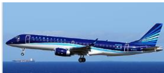
L'Embraer 190 precipitato

Precisata la causa della sciagura rimarrà da chiarire per quale motivo un volta giunto su Grozny e non avendo potuto atterrare a causa della nebbia, è stato deciso di puntare verso Akthau dalla parte opposta del Mar Caspio anziché su scali più vicini alla destinazione originaria, ma ciò sarà chiarito dalle commissioni di inchiesta che prenderà visione di quali erano gli scali alternati previsti dal piano di volo.